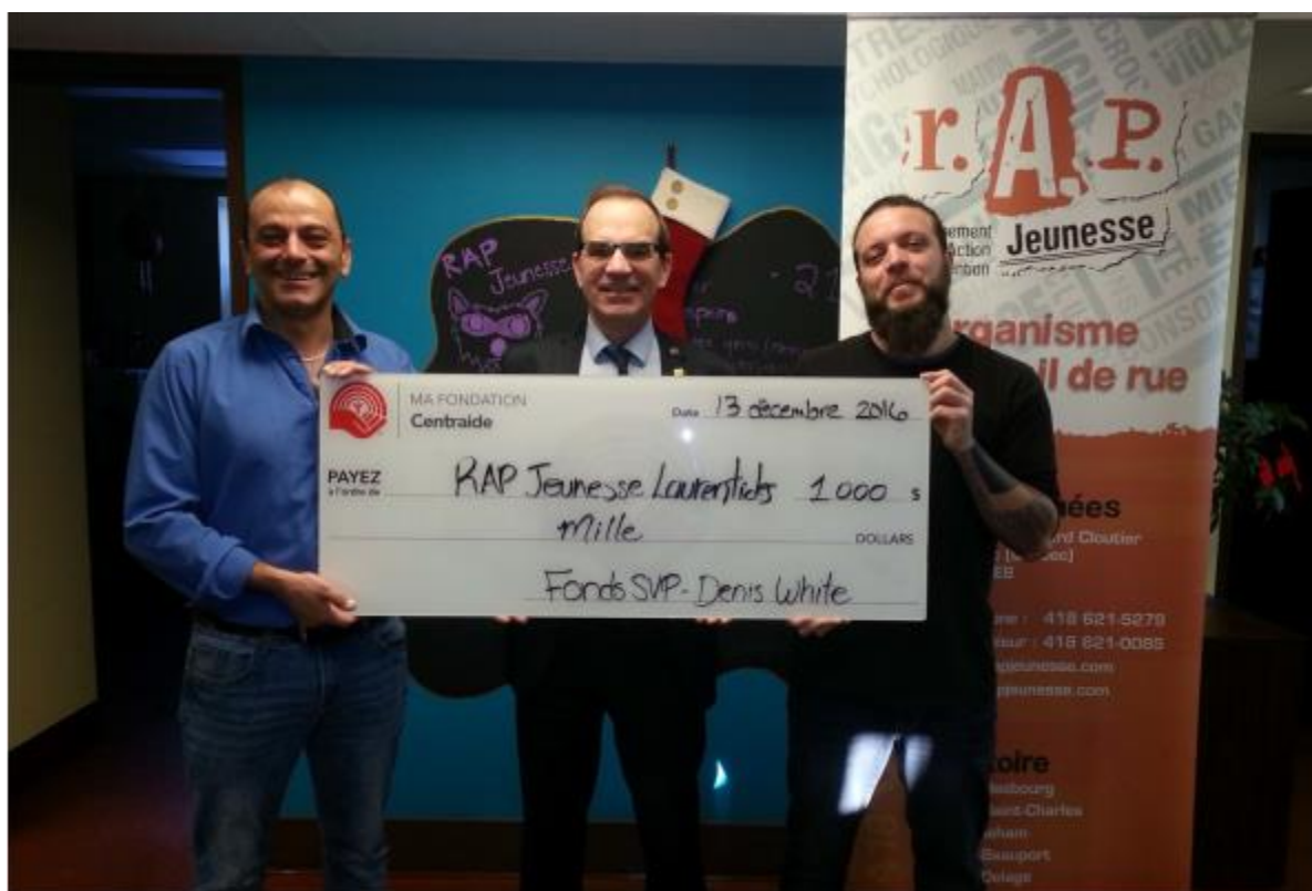
RAP Jeunesse Laurentides, 13 décembre 2016