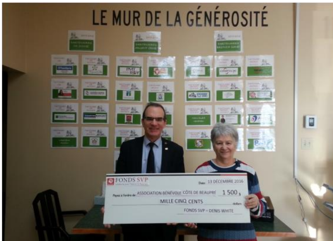
Association Bénévole Côte-de-Beaupré, 13 décembre 2016