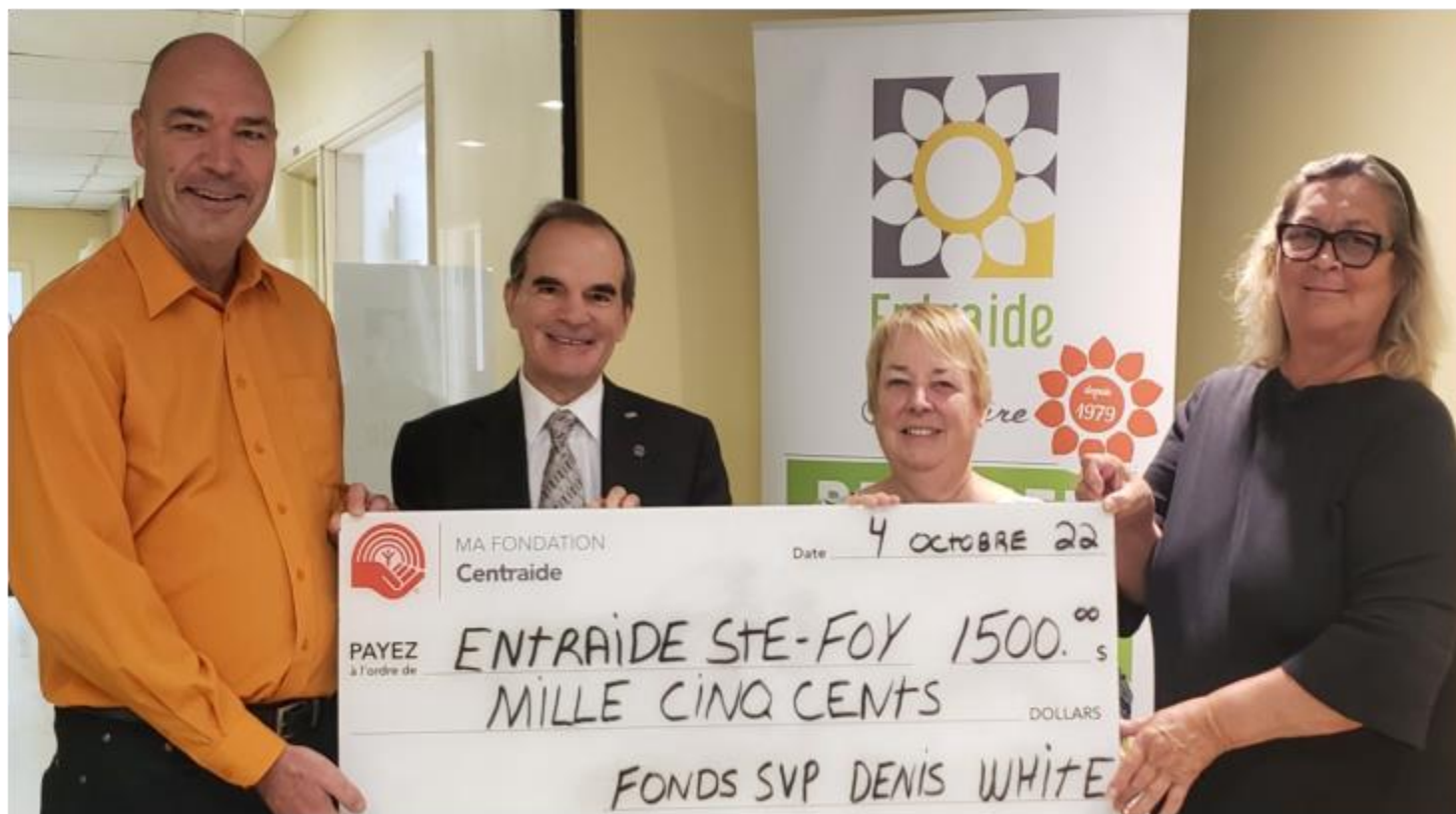
Entraide Sainte-Foy, 4 octobre 2022