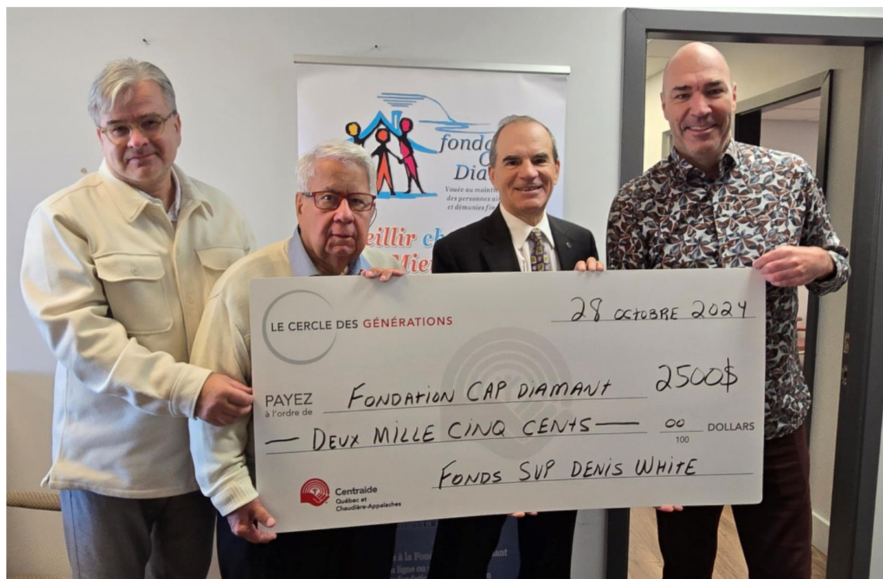
Fondation Cap Diamant, 28 octobre 2024