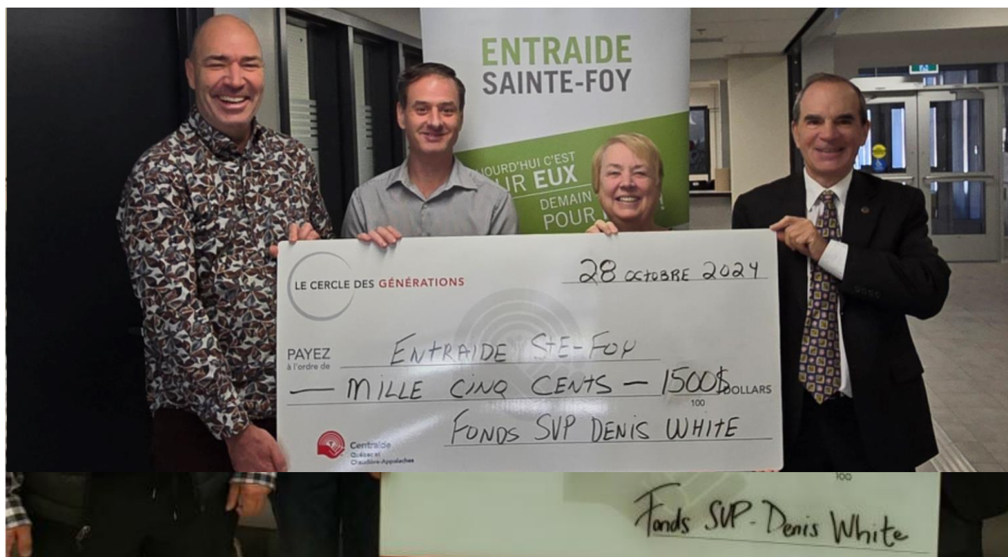
Centre Bonne Entente, 5 octobre 2022