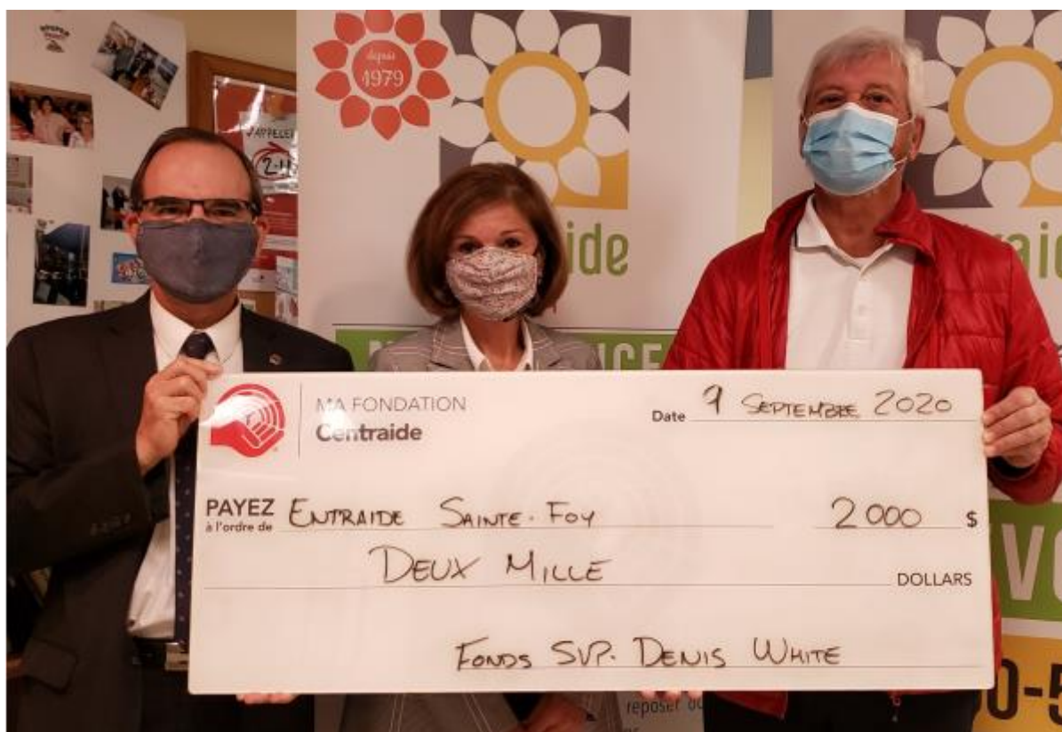
Entraide Sainte-Foy, 9 septembre 2020