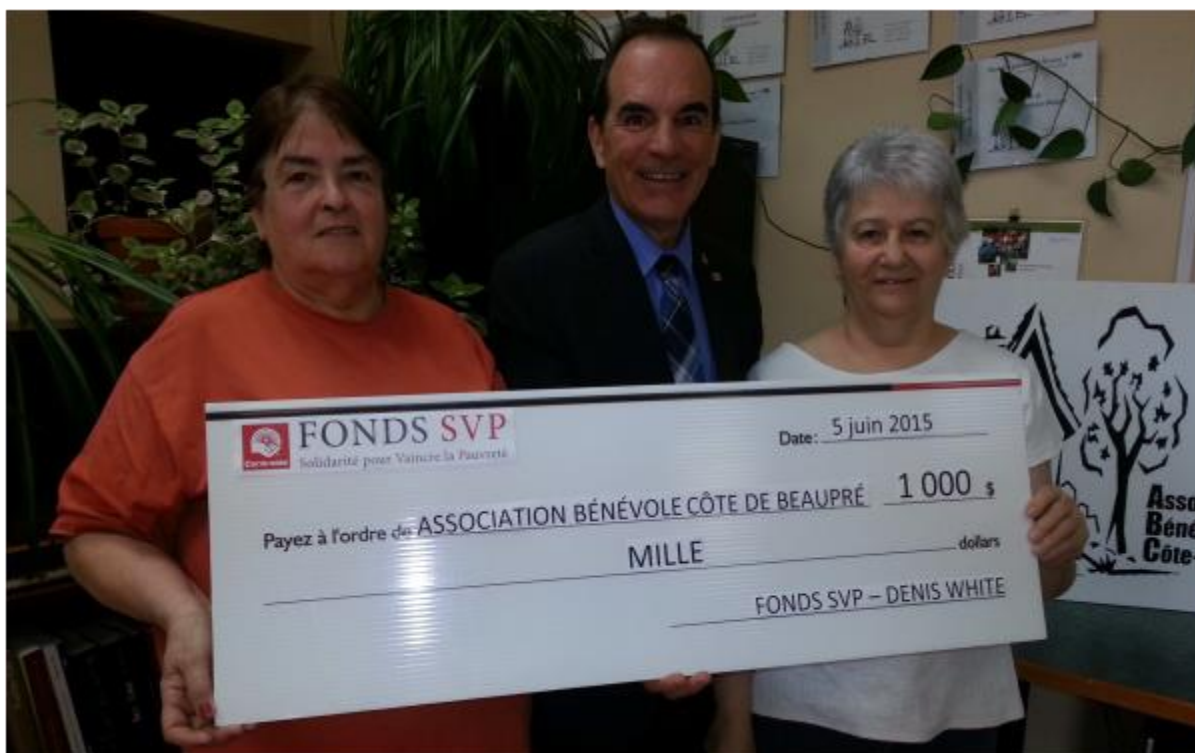
Association Bénévole Côte-de-Beaupré, 5 juin 2015