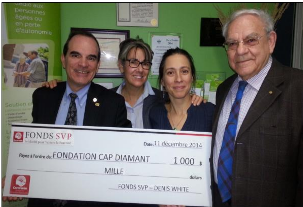
Fondation Cap Diamant, 11 décembre 2014