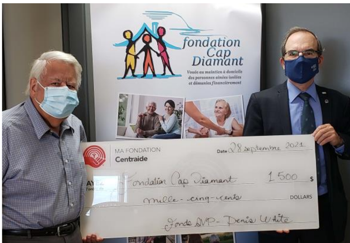
Fondation Cap Diamant, 28 septembre 2021