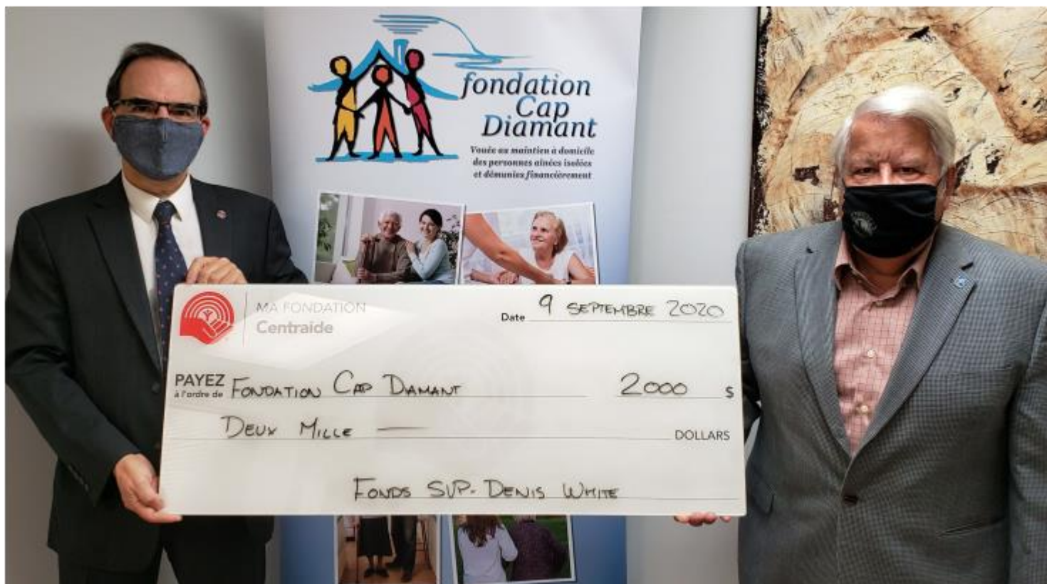
Fondation Cap Diamant, 9 septembre 2020