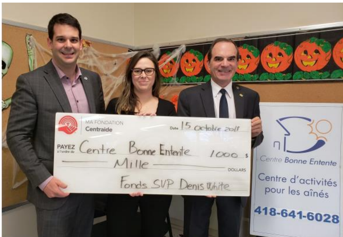
Centre Bonne Entente, 15 octobre 2018