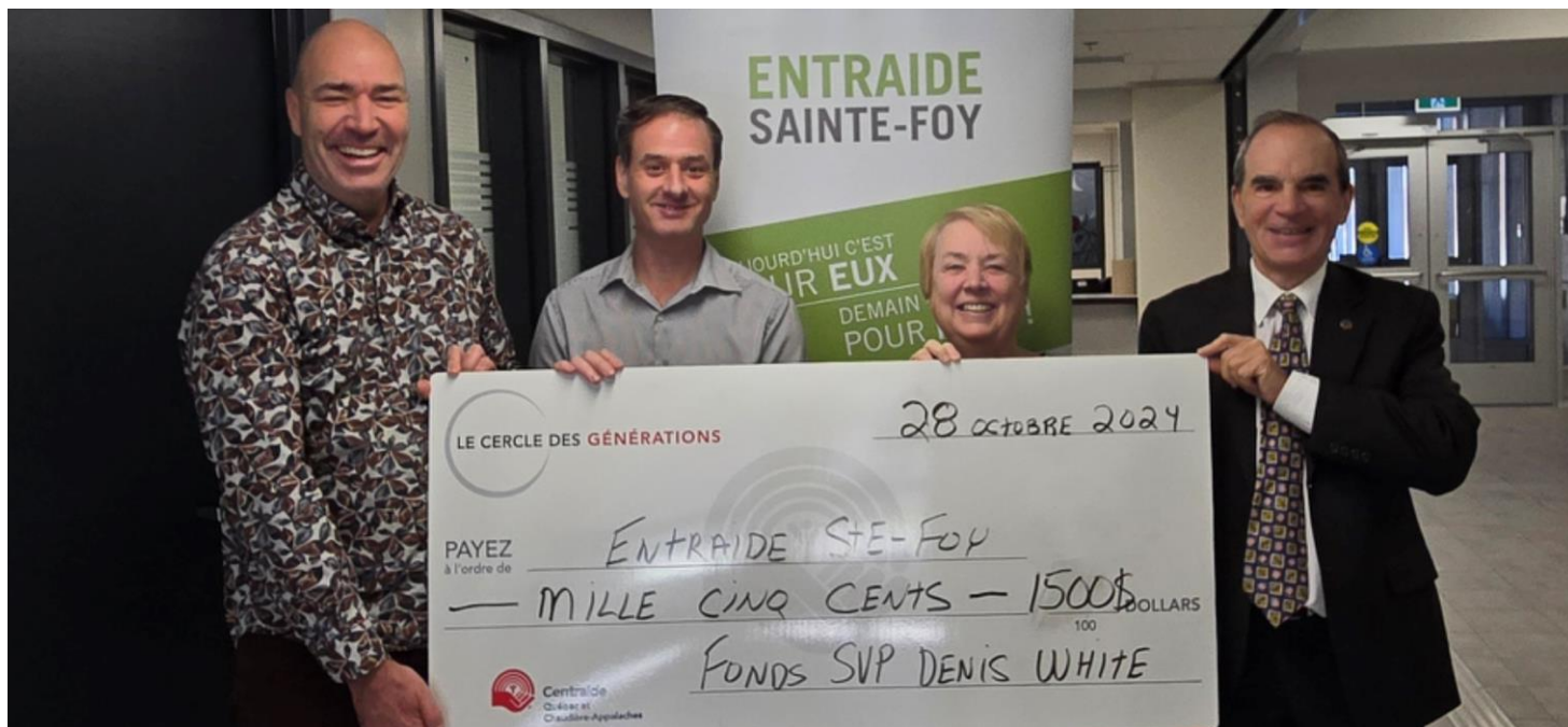
Entraide Sainte-Foy, 28 octobre 2024