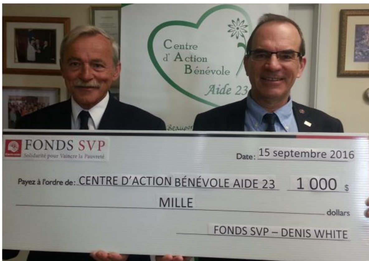
Centre d'Action Bénévole Aide 23, 15 septembre 2016