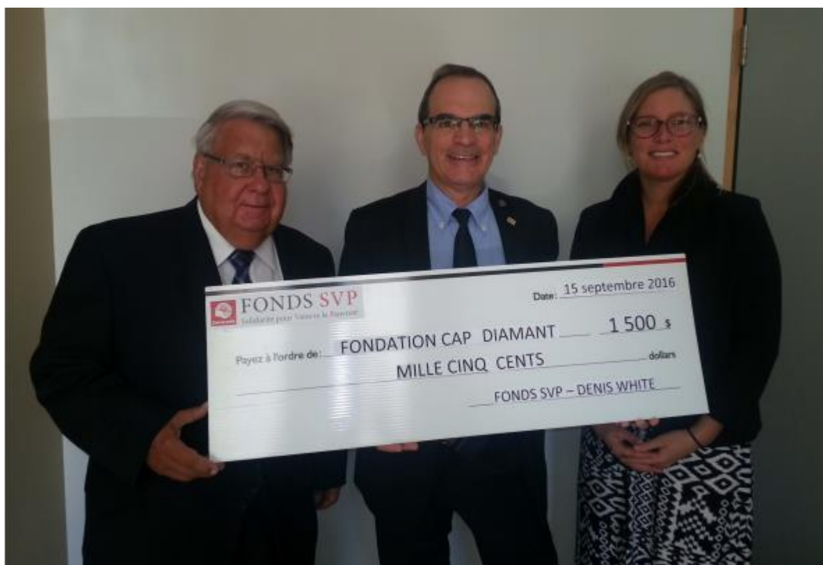
Fondation Cap Diamant, 15 septembre 2016