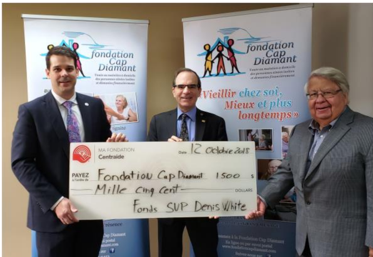
Fondation Cap Diamant, 12 octobre 2018