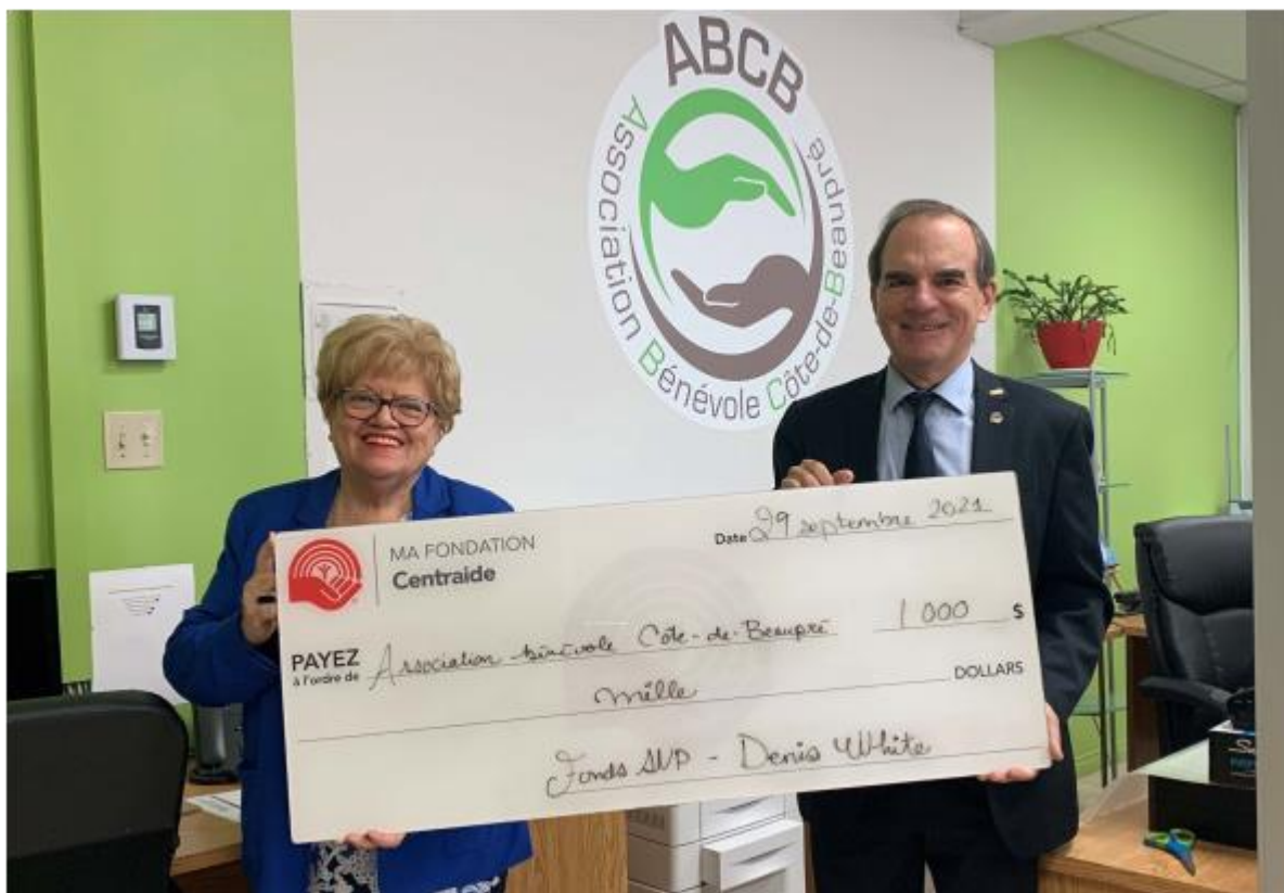
Association Bénévole Côte-de-Beaupré, 29 septembre 2021