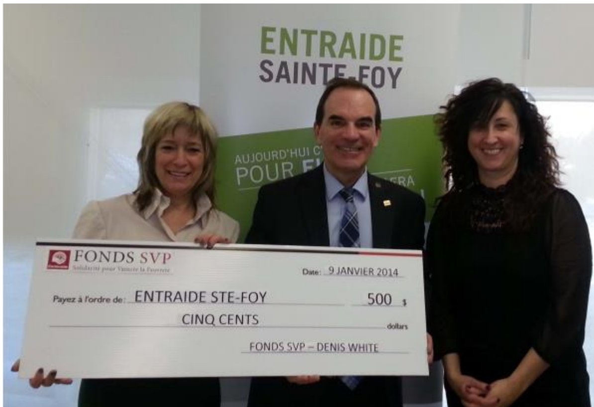
Entraide Sainte-Foy, 9 janvier 2014