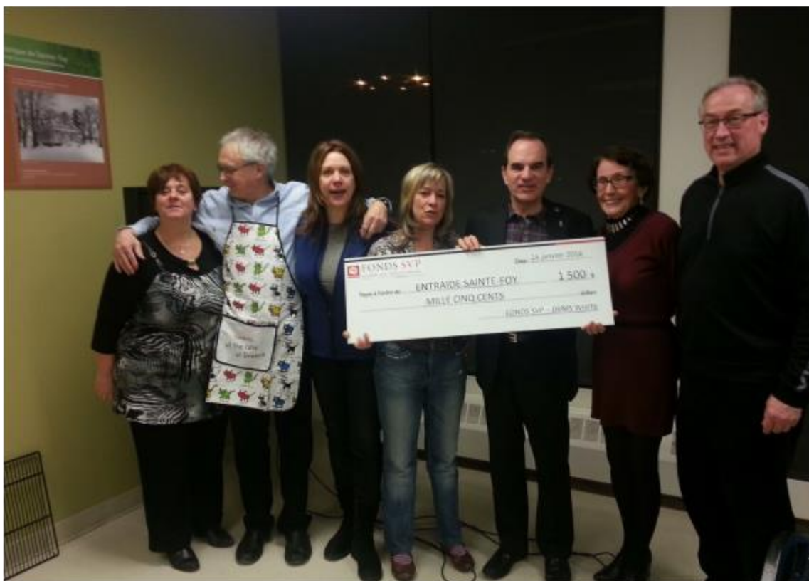
Entraide Sainte-Foy, 24 janvier 2016