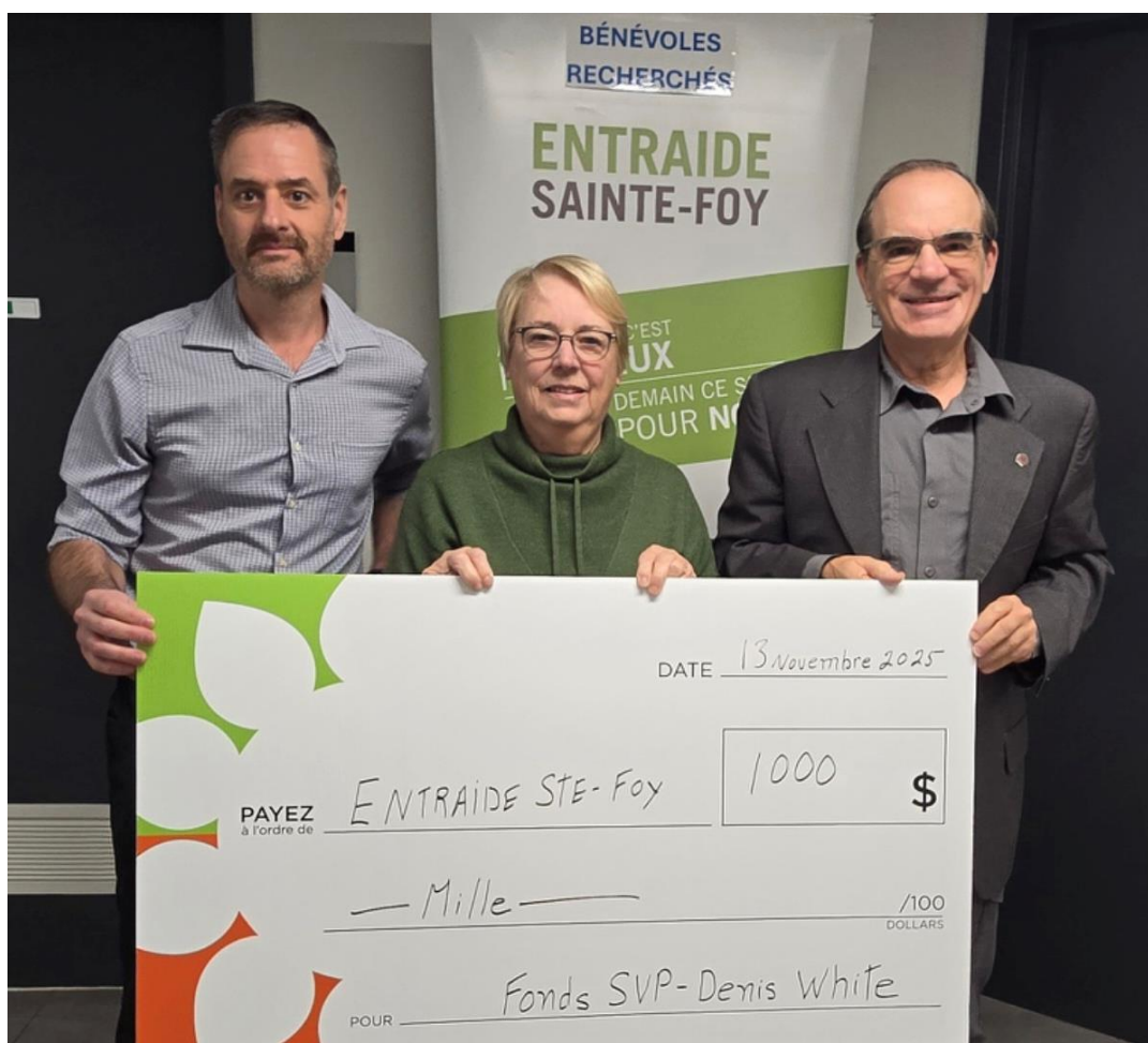
Entraide Sainte-Foy, 13 novembre 2025