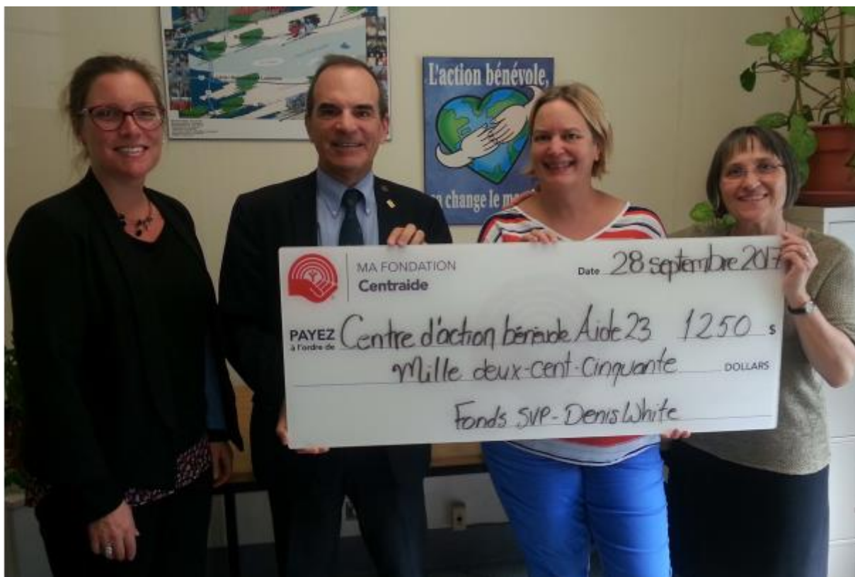
Centre d'Action Bénévole Aide 23, 28 septembre 2017