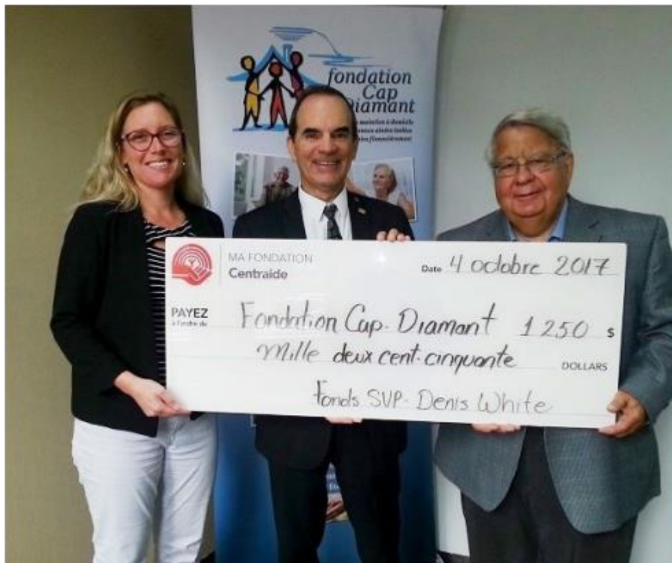
Fondation Cap Diamant, 4 octobre 2017