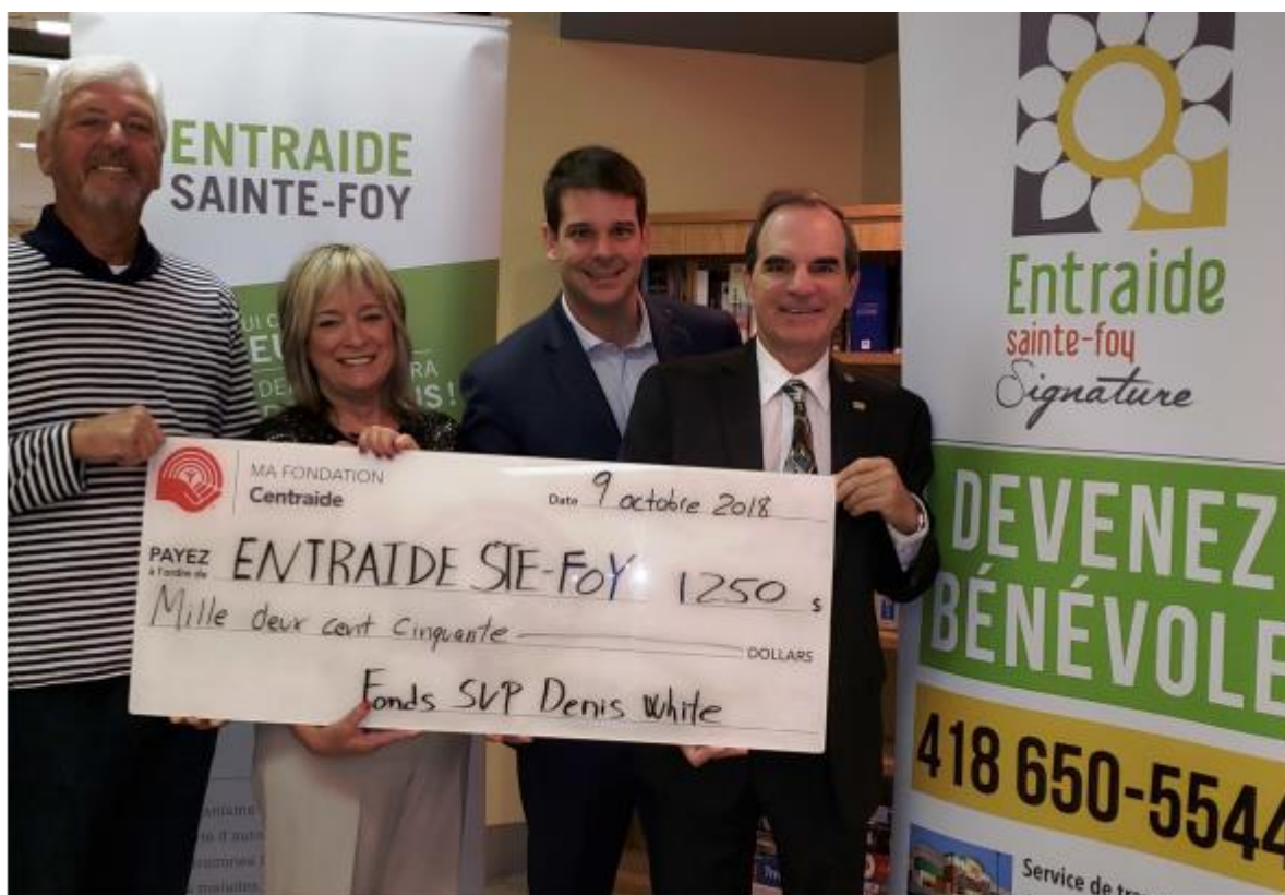
Entraide Sainte-Foy, 9 octobre 2018