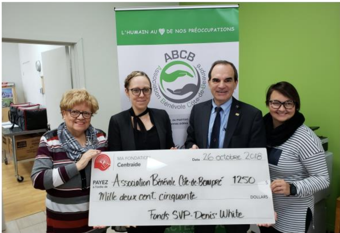
Association Bénévole Côte-de-Beaupré, 26 octobre 2018