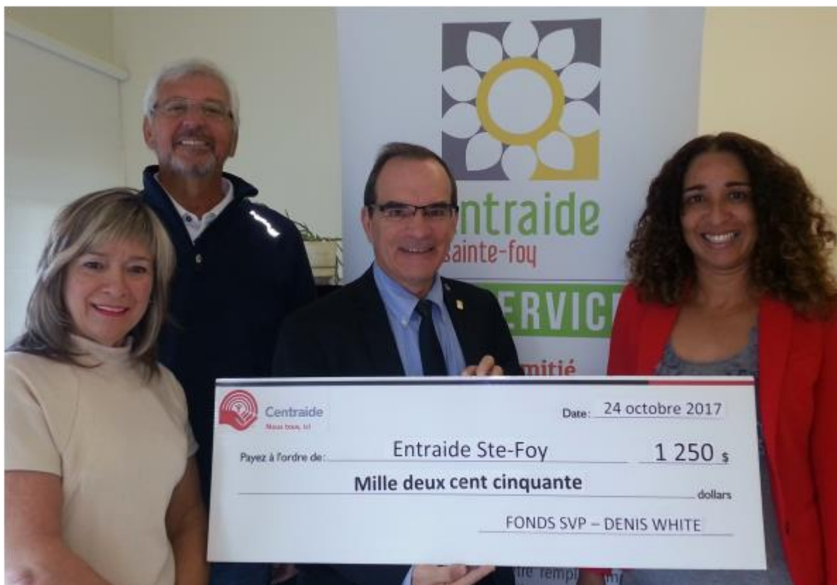
Entraide Sainte-Foy, 24 octobre 2017