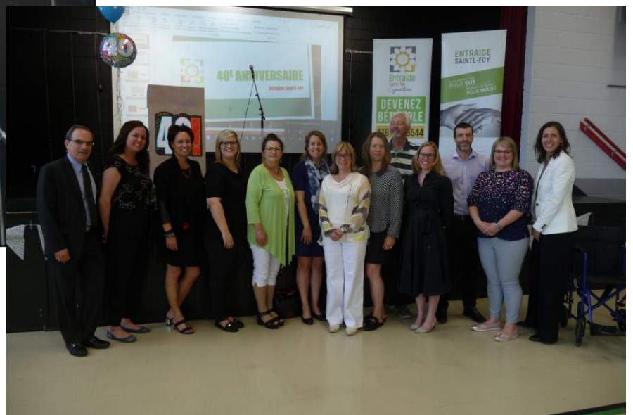
40e anniversaire Entraide Sainte-Foy, 2019