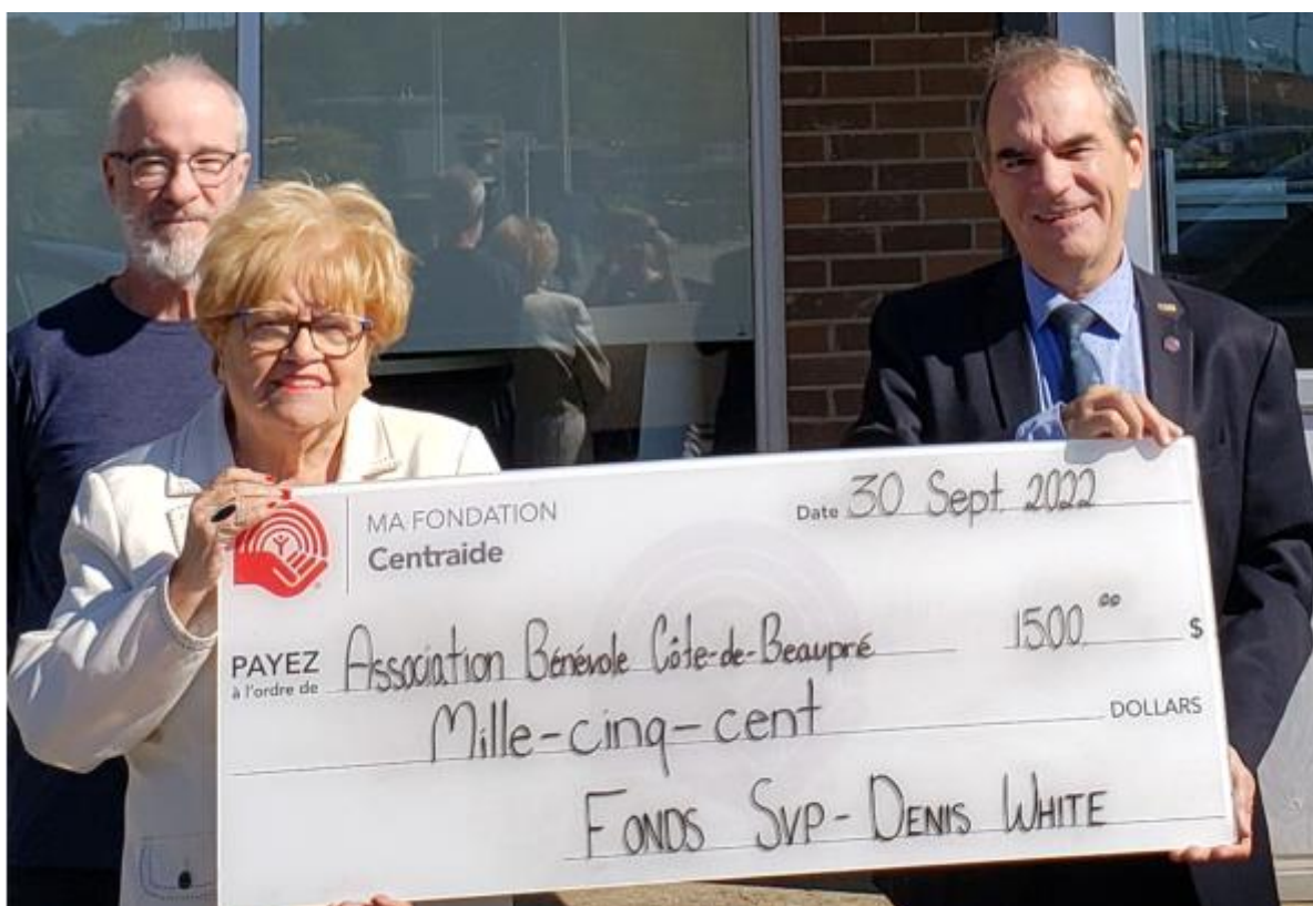
Association Bénévole Côte-de-Beaupré, 30 septembre 2022