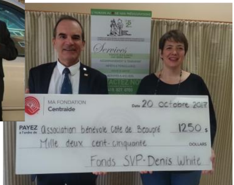
Association Bénévole Côte-de-Beaupré, 20 octobre 2017