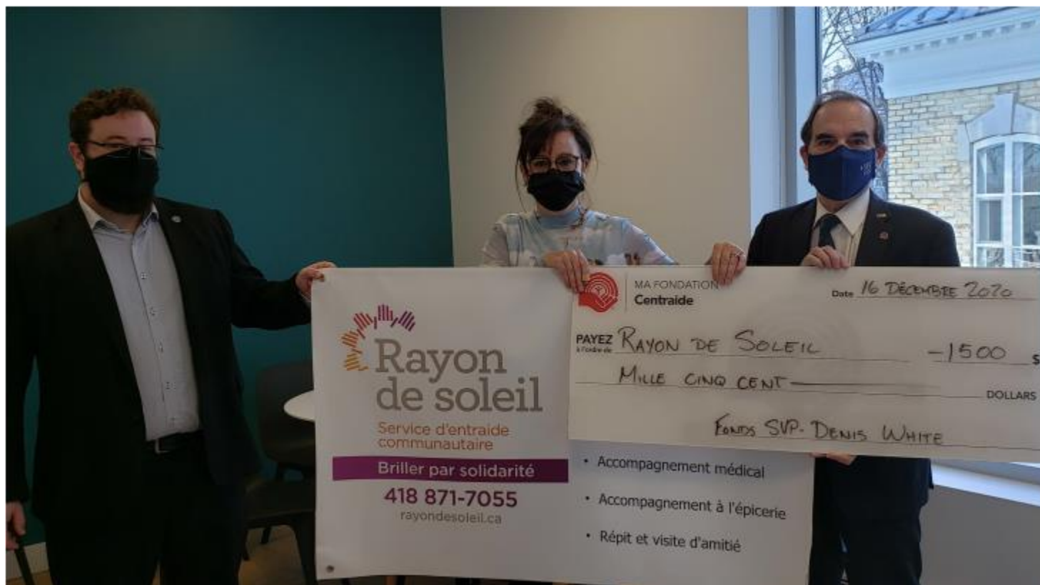
Rayon de soleil, 16 décembre 2020